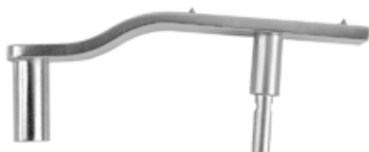
Guía Fija para Placas 95°