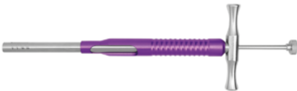
Desarmador Canulado p/Deslizante c/Centralizador (Morado)