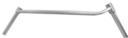
Guía de Broca 3.2/4.5 mm