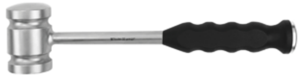
Martillo con Mango de Silicon Mediano