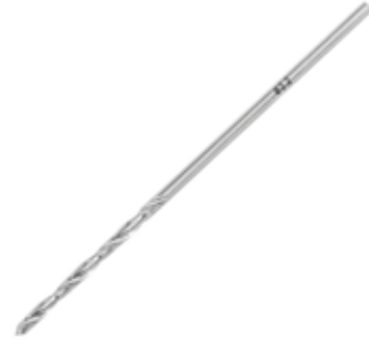
Broca 3.2 mm