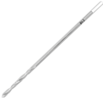
Broca 4.5 mm