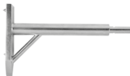
Guía Fija para Placas 135°