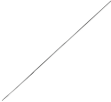
Alambre Guía 2.0 mm