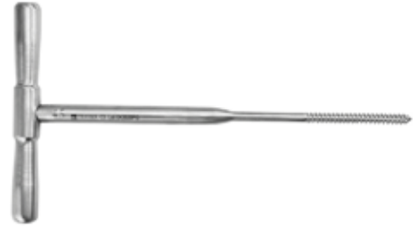
Machuelo 4.5 mm