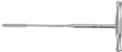
Machuelo 6.5 mm