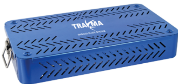
Caja para Esterilizar