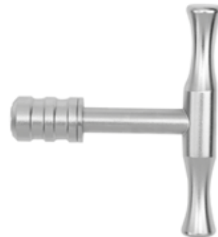
Mango en T P/Entrada E-Quick