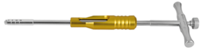
Desarmador Canulado p/Deslizante c/Centralizador (Amarillo)