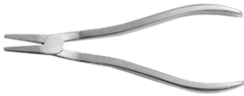
Pinza Dobladora de Placas