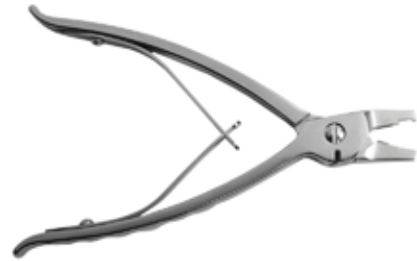
Pinza Cortadora de Placas