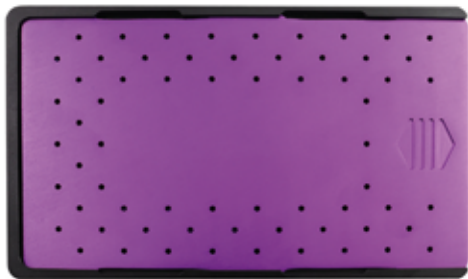
Plaquera 2.0 mm