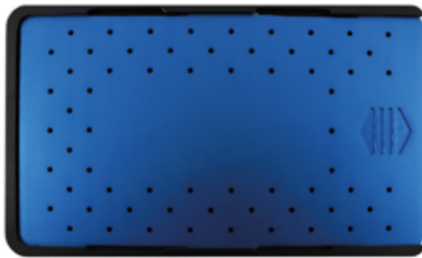
Plaquera 2.4 mm