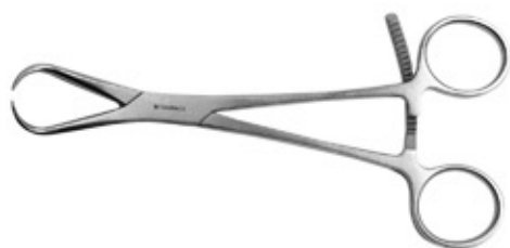
Pinza tipo Campo