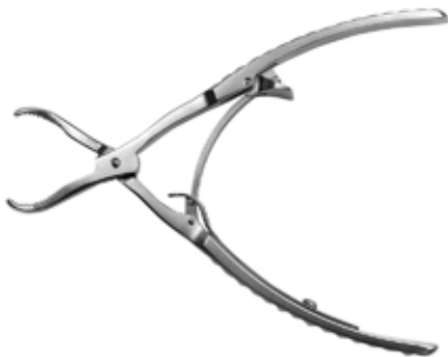
Pinza tipo Cangrejo