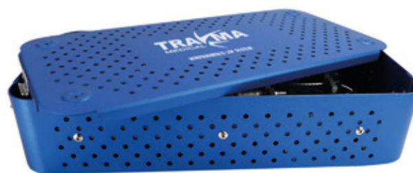
Caja para Esterilizar