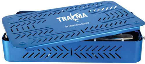
Caja para Esterilizar Instrumental