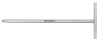
Maneral en T para Probadores de Cabeza Femoral