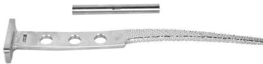
Rima para Lazcano c/ Barra de Thomy