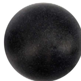
Probador de Cabeza Femoral 54 mm