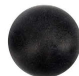
Probador de Cabeza Femoral 36mm