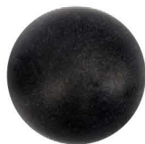
Probador de Cabeza Femoral 38 mm