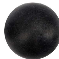
Probador de cabeza Femoral 42 mm