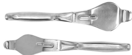
Par de Separadores Bennet