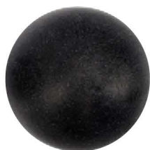
Probador de Cabeza Femoral 44 mm