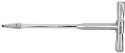
Extractor en Espiral p/Cabeza Femoral